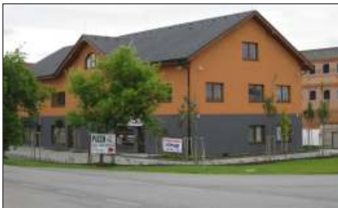
Pohled na budovu lékařského domu, příjezd z centra Jesenice.