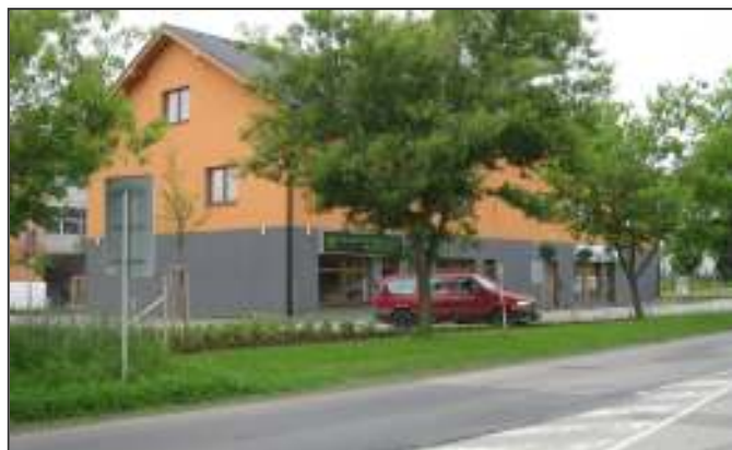
Pohled na budovu lékařského domu, příjezd od Kocandy a Řičan.